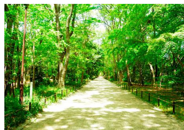
ただす もり 糺の森

◆京都の北の方はこれまであまり行 ったことがないイメージです。下鴨神社は個人的に毎年 行っていますが、 ただす もり ある こ ころ 糺の森を歩くだけで心がきれ いになる感じで、ぜひおすすめしたいところ です。天気良ければ宝ヶ池公園なんかも気持ち よさそうですね。